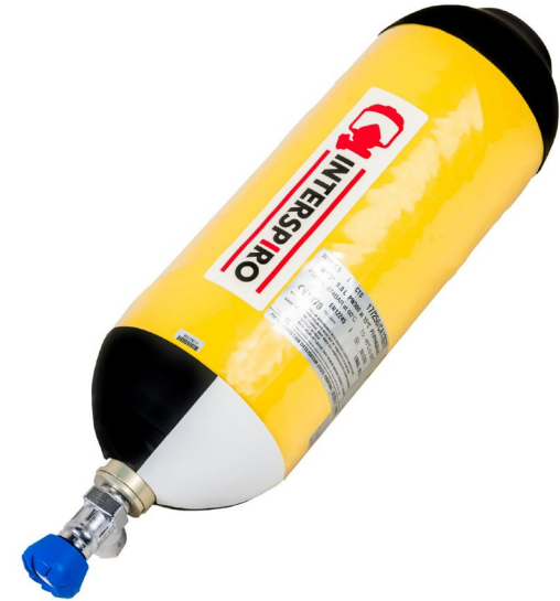
Helkomposit - 9.0 L